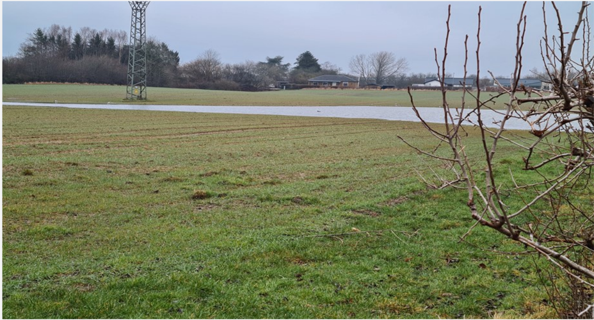
Kornmark - nu med lille sø med ænder og måger

Hjemmeside - http://www.sct-georg-odense.dk/4-sct-georg-gilde/