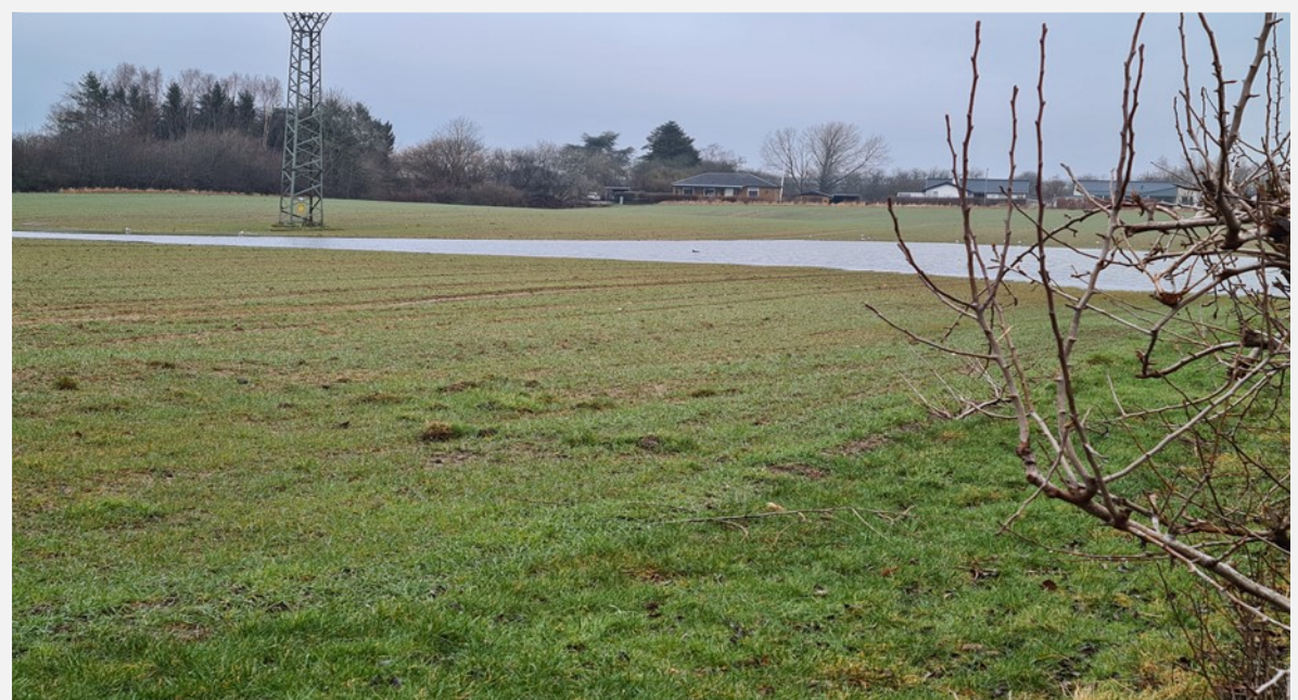
Kornmark - nu med lille sø med ænder og måger

Hjemmeside - http://www.sct-georg-odense.dk/4-sct-georg-gilde/